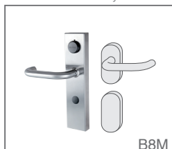
für Rohrrahmen Türsystem